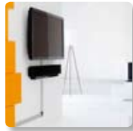
Göm kablarna. SMS Cable Management.

SMS Flatscreen WM 3D Piano Black SMS Flatscreen WM 3D Glossy White SMS Flatscreen WM 3D Dark Grey